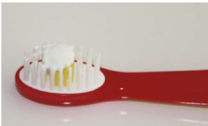
Abb. B: Erbsengroße Menge an Kinderzahnpaste