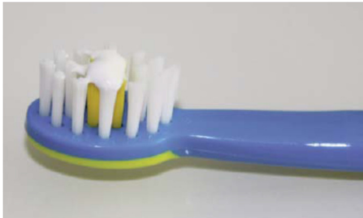
Abb. A: Dünner Film an Kinderzahnpaste

Zahnärztliche Empfehlung zur Anwendung von Kinderzahnpaste